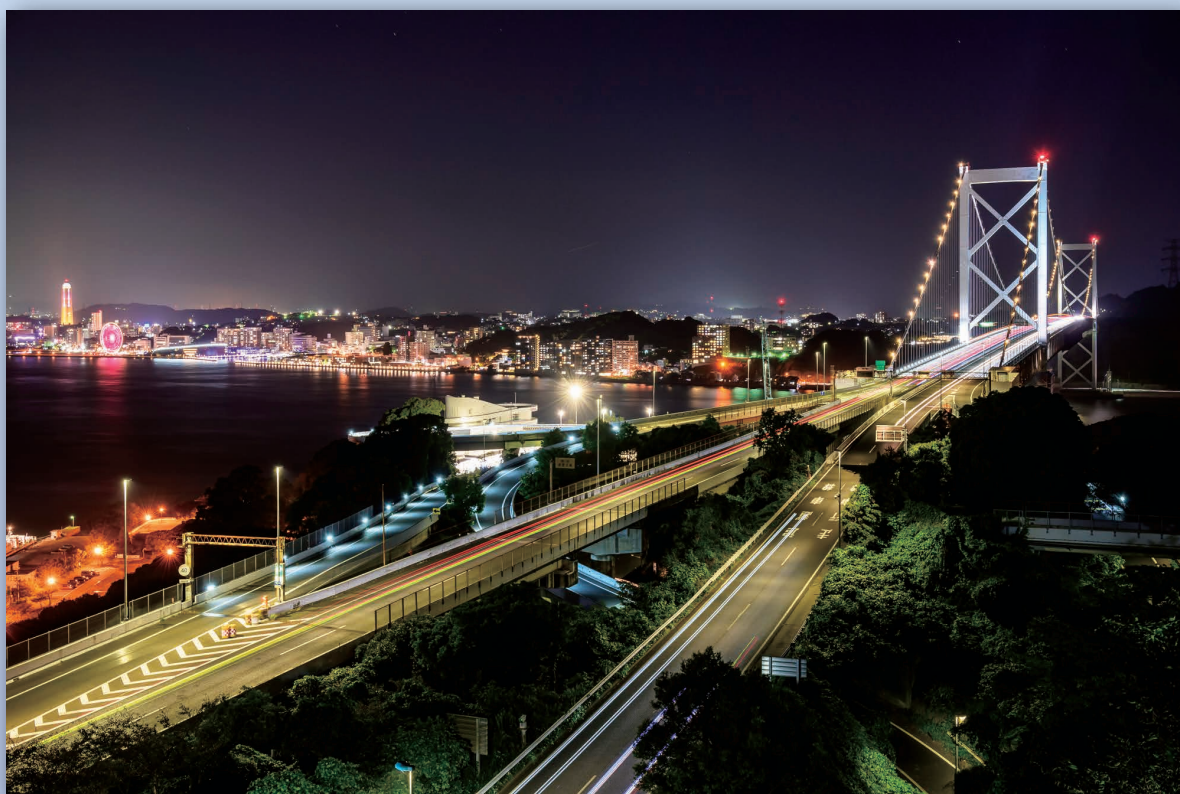
和布刈公園第2展望台からの夜景（ふるさと便り参照）